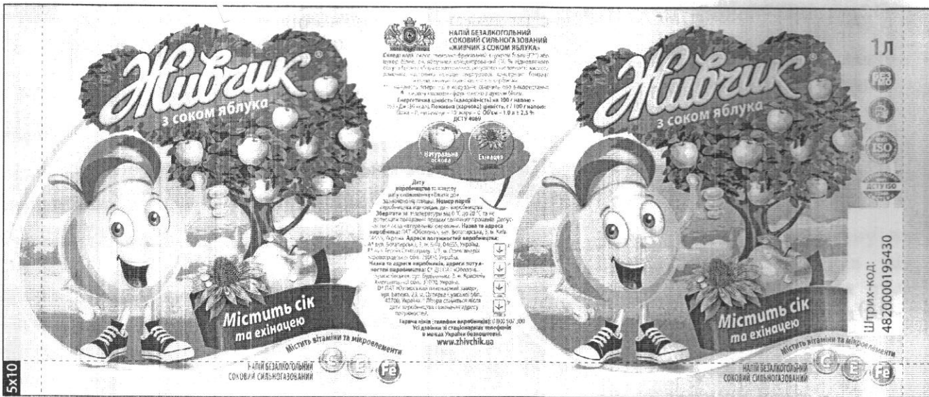
Рис. 1 Етикетка напою «Живчик з соком яблука»