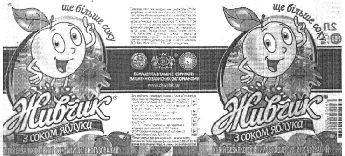
Рис. 3 Попередня етикетка напою «Живчик з соком яблука»