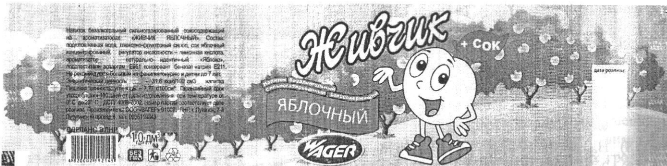
Рис. 2 Етикетка напою «Живчик яблочний»