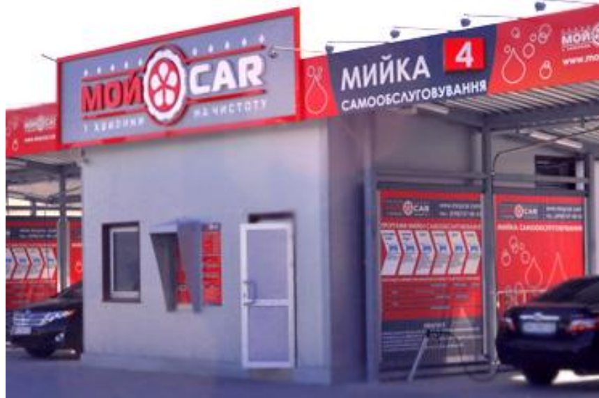
Зображення 10 ( https://моуcar.com/ )