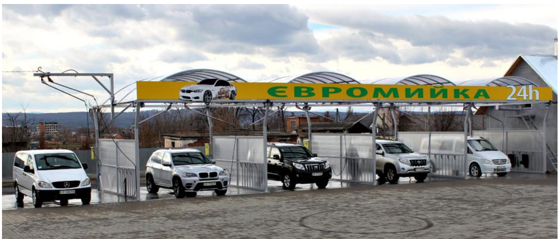
Зображення 9 ( https://storozhynets.info/8377-2 )