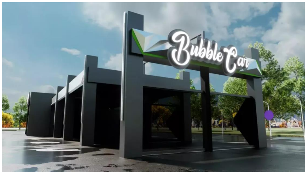
Зображення 8 ( https://ratelist.top/232754 )