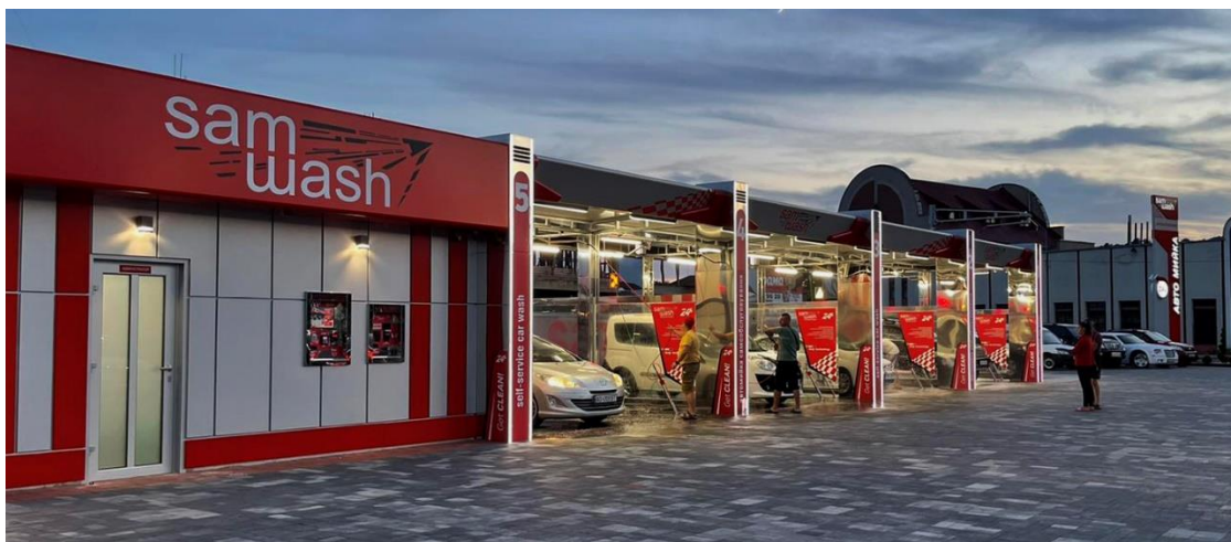
Зображення 11