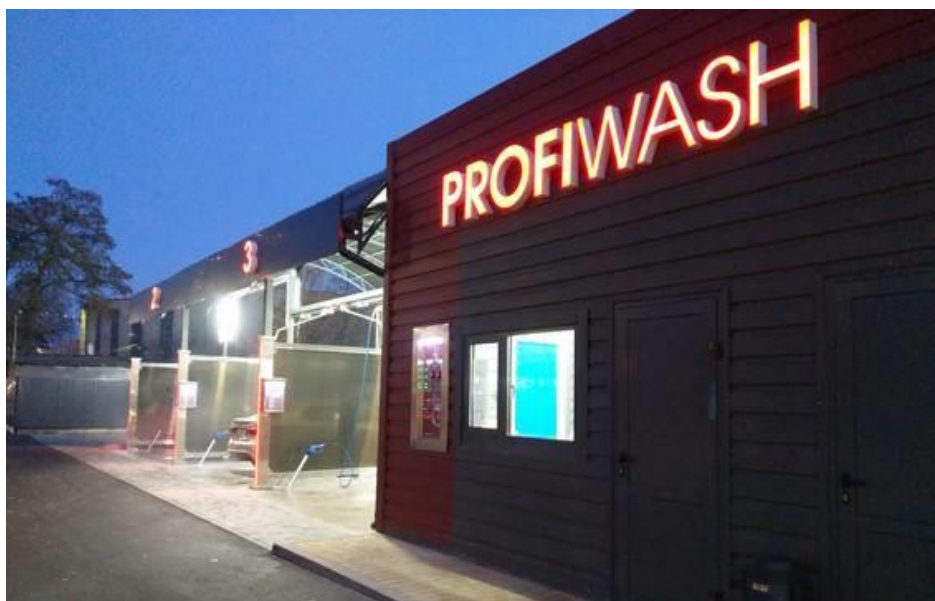
Зображення 12