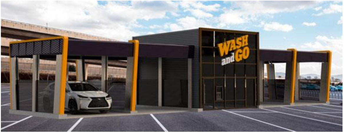
Зображення 7 ( https://washercar.ua/ru/franchise/ )